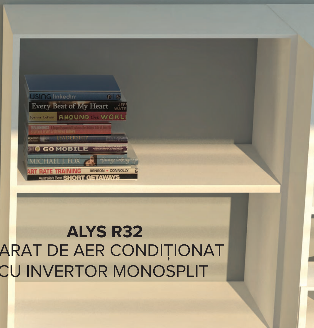
ALYS R32 APARAT DE AER CONDIȚIONAT CU INVERTOR MONOSPLIT